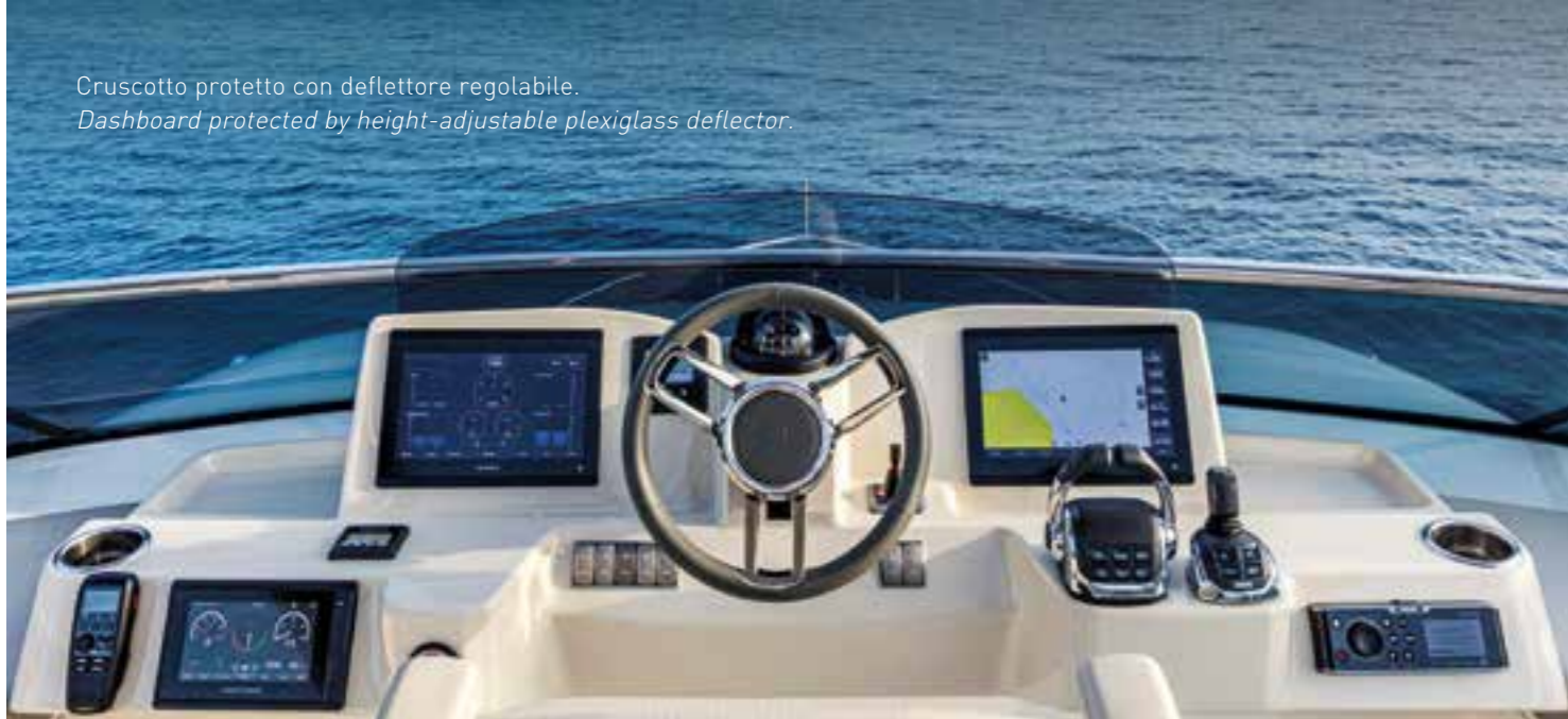
Cruscotto protetto con deflettore regolabile. Dashboard protected by height-adjustable plexiglass deflector.