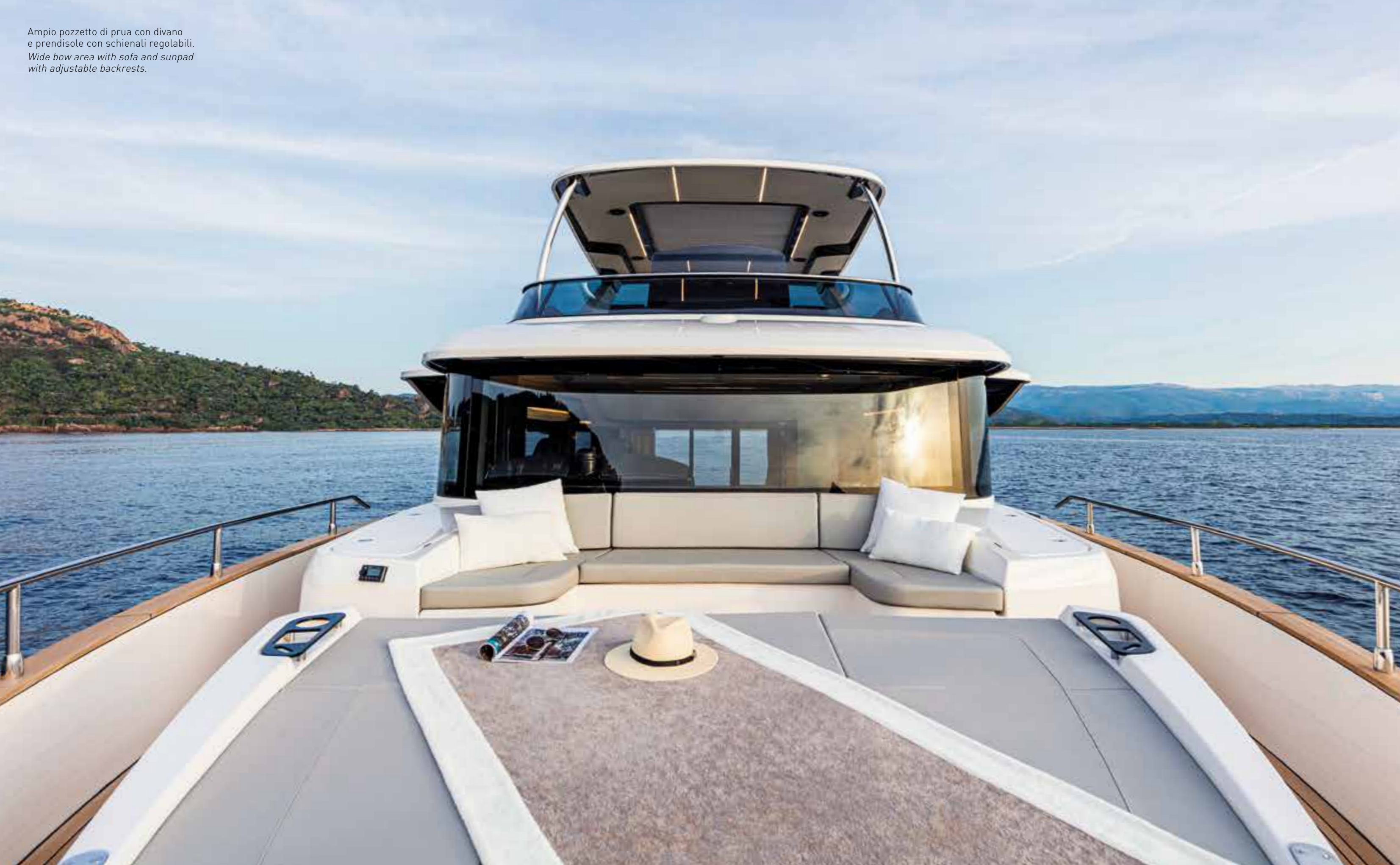
Ampio pozzetto di prua con divano e prendisole con schienali regolabili. Wide bow area with sofa and sunpad with adjustable backrests.