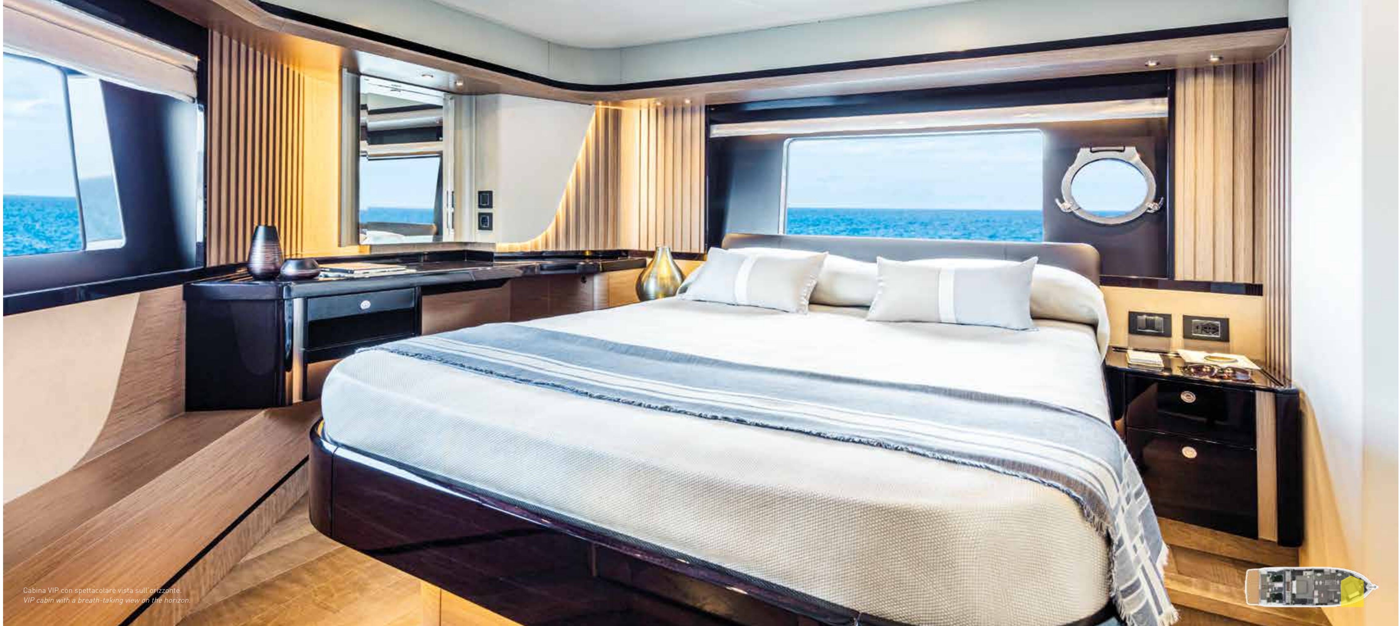
Cabina VIP con spettacolare vista sull'orizzonte. VIP cabin with a breath-taking view on the horizon.